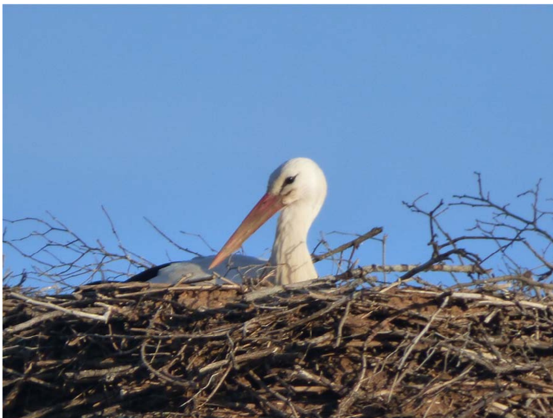
Cigüeña blanca en su nido, en Riahueltas (Segovia).