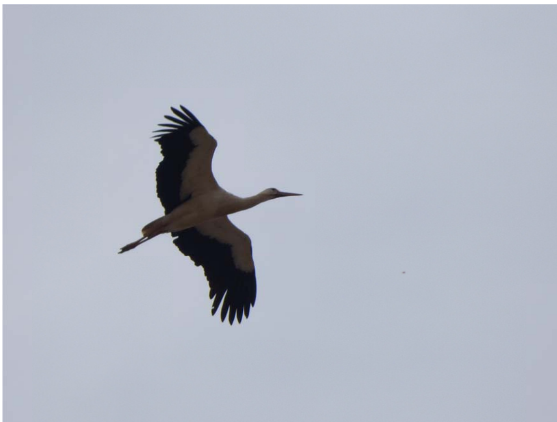
Cigüeña blanca volando en Montejo de la Vega.