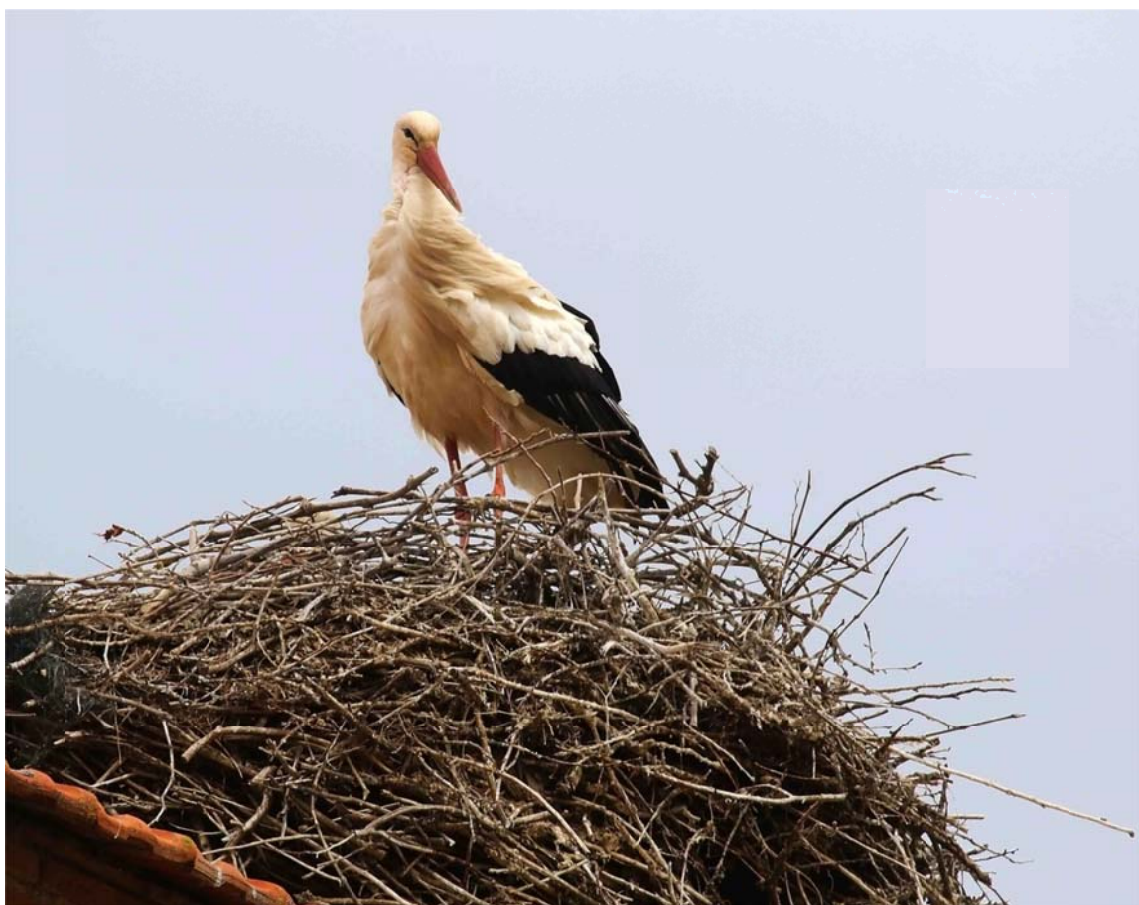
Cigüeña blanca en el nido de Milagros (Burgos).

(Censos realizados por Fidel José Fernández y Fernández-Arroyo).